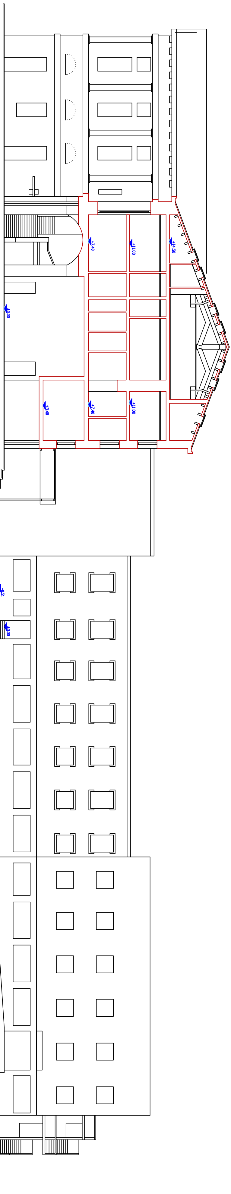
SCHEMA SEZIONE A/1